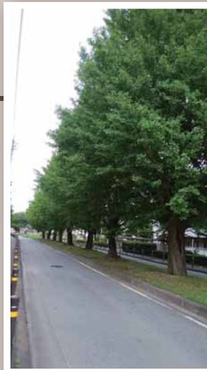
▲都営瑞穂アパート付近