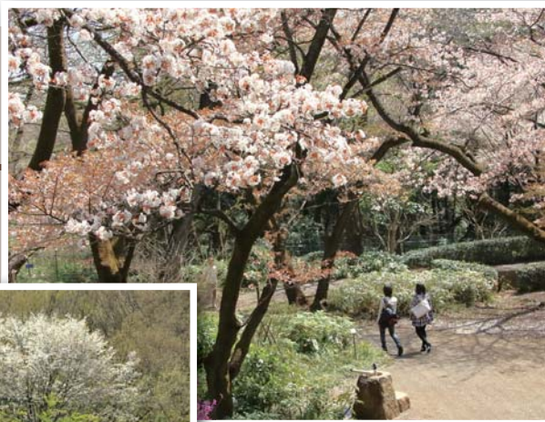
▲桜満開風景 (六道山公園)