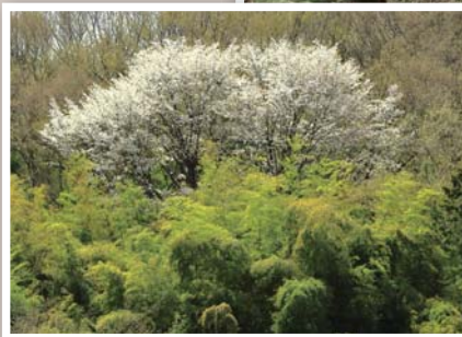
◀山桜と竹林 (寿楽駐車場付近)