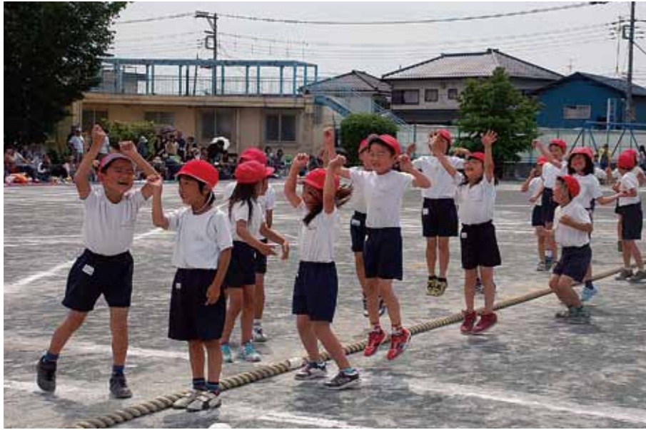
5月23日に行われた第一小学校の運動会

契約金額：7,909万4,880円 (落札率 80.3%) 契約相手：長谷川体育施設株式会社 工期：平成27年11月27日