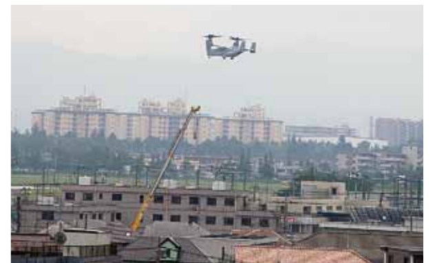
横田基地に飛来するMV-22オスプレイ(役場屋上より)

各会派代表の議員5名から横田基地へのオスプレイの配備に関する決議案が提出されました。