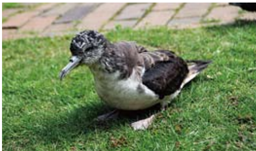
「ようこそ瑞穂町へ」 台風4号の際、迷い込んだ海鳥（オオミズナギドリ）