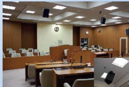
LED化された議場の照明