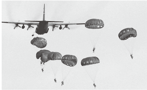
横田基地で行われたサムライサージ訓練

質問 先頃、石原都知事はアメリカに行き、横田の問題についても言及し、横田の問題は日本の問題であるとの感触を得たと述べた。