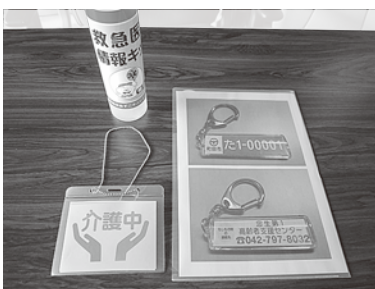
他自治体で導入されている高齢者支援グッズ

質問① 高齢者あんしんグッズの導入されている自治体で導入されている高齢者支援グッズ