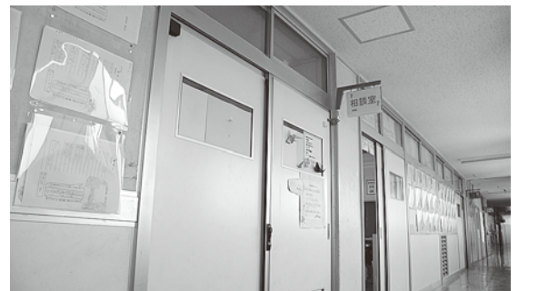
各学校に設けられている相談室。

質問 小中学校における、不登校やいじめの問題、学級崩壊などが各地で社会問題となつて久しいが、町における現状と今後の課題対策について教育長の所見を伺う。