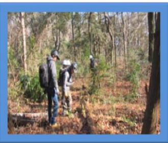
整備箇所の調査中

町民(ボランティア団体)、地権者、町とで協力して、道に落ちているゴミ等の清掃を行い、うっそうとしていた樹林地を整備しました。これで太陽の光もふりそそぎ、景観が良くなりました!!