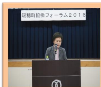
サロン活動の経験談