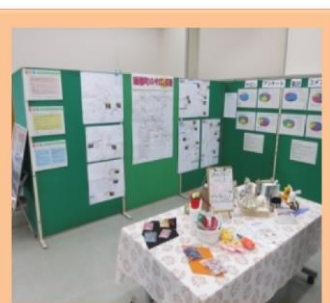
サロン活動で作った作品

1人でも多くの方が引きこもりをしないで、外で活動ができるように、サロンの場所がわかるように地図に表記したり、サロン活動のひとつである琴演奏をフォーラムで披露しました♪ボランティアセンターみずほと連携し、ボランティアの方々と一緒に活動しました。