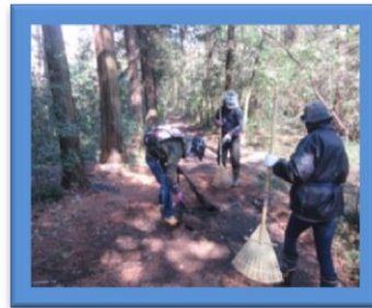
この落ち葉は堆肥にしよう! こんなにきれいになりました!