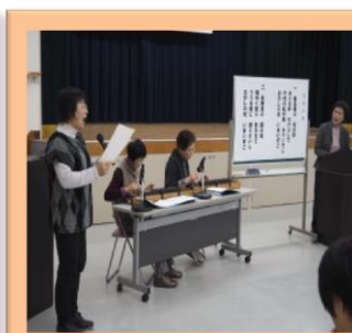
サロン活動での琴演奏