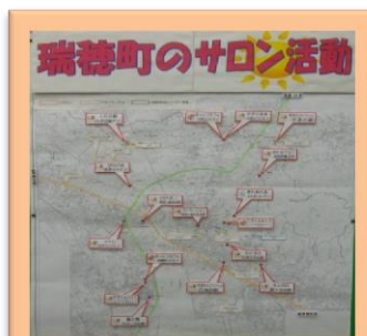
サロンの場所が一目でわかる地図