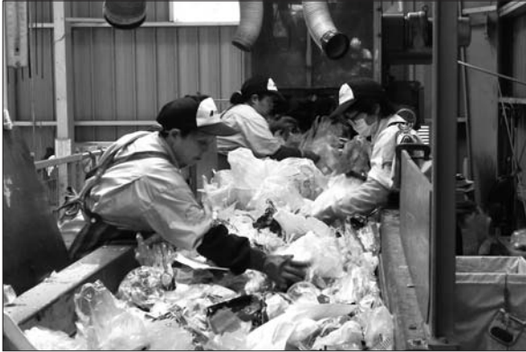
(手作業による選別の様子)

各家庭から出された容器包装プラスチックは、リサイクルプラザ内の施設で処理されています。今回はここで一番重要で大変な手作業による選別をご紹介しますとともに、皆さまへお願いをしたいと思います。