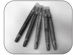
<混入していた危険なもの>