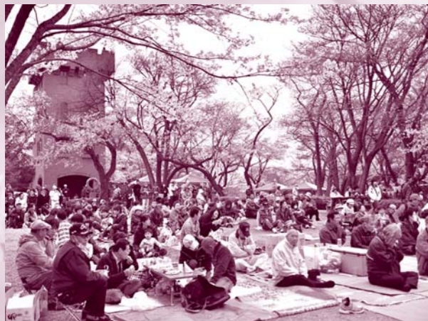
▲桜の木の下で各々に楽しみ、多くの人が賑わう会場(昨年の様子)

日時 4月2日(日) 午前10時～午後3時(雨天中止) 場所 六道山公園 イベント 野だて、大道芸、甘酒無料サービス、おはやし、カラオケ、舞踊、お楽しみ抽選会など ※お楽しみ抽選会に参加するには、チラシについている抽選券が必要です。また、先着順で商品が無くなり次第終了します。 ※駐車場がありませんので、車での来場はご遠慮ください。 ※天候などにより、内容や時間に変更になる場合があります。 ※詳しくは、差し込みチラシをご覧ください。 問合せ 観光協会 ☎557-3389