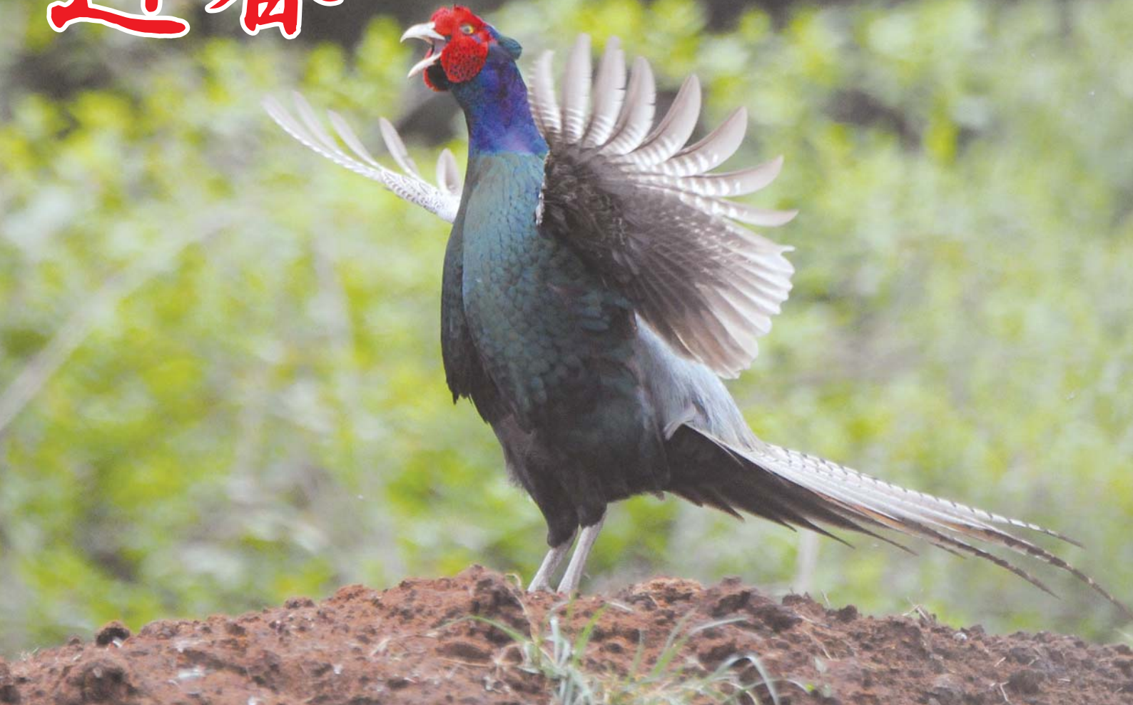
撮影場所：長岡長谷部