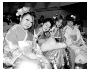
▲昨年の成人式の様子

日時 平成29年1月8日(日) 午前10時開式 場所 スカイホール大ホール 対象 平成8年4月2日から平成9年4月1日生まれの方 日生まれの方 ※該当する方(住民基本台帳に記載されている方)には、12月上旬に案内状を郵送します。届かない場合は、ご連絡ください。