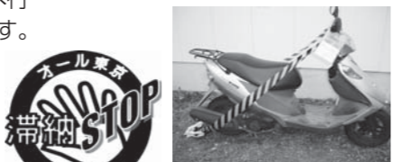
タイヤロックされた原付バイク