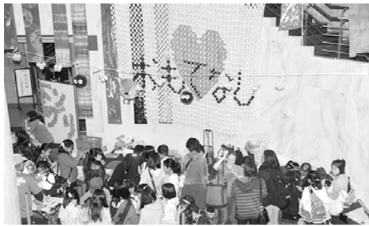
あなたのセンスが光る！飾りつけ

期間 10月14日から平成29年2月24日までの第2、4金曜日 時間 午後7時30分～9時 場所 中央体育館 対象 町内在住の小・中学生 費用 無料 申込み 瑞穂町ビーチボール連盟事務局小山へ TEL 090(2438)3134