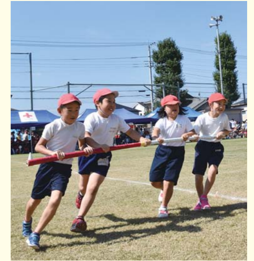
▲3年生による「台風の日」

爽やかな秋晴れの下、行われました。子どもたちは元気いっぱいに緑の校庭を駆け回り、日ごろの練習の成果を存分に発揮していました。