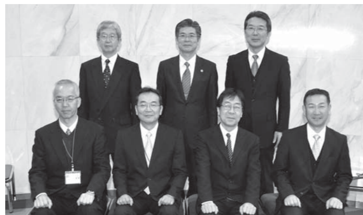
※町ホームページ内「教育委員会」の中でも、紹介しています。