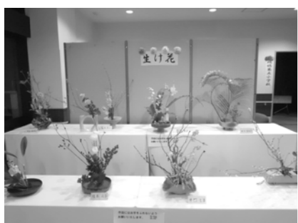
▲昨年のじゅらく文化祭

日時 3月5日(土)〜12日(土) 午前9時〜午後4時30分 (12日(土)は午後4時まで) ※7日(月)は休館日です。 ※期間中は作品展示のため、図書室、調理室、研修室、茶室は利用できませんが、浴室、マッサージ機、カラオケ(カラオケのみ12日(土)利用不可)は、通常通り利用できます。詳しくは、お問い合わせください。