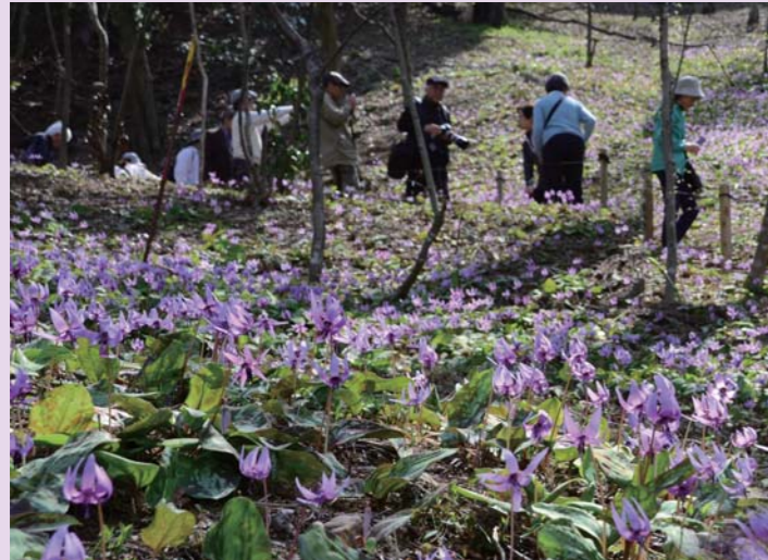
毎年多くの人で賑わいます