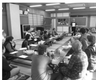
▲高齢者サロン「ほたるサロン」

地域の方々といっしょに、交流・仲間づくりのサロン活動を行っています。現在は、高齢者サロンが13カ所、子育てサロンが3カ所、障がい者サロンが1カ所あります。日時や活動内容は、各々異なります。詳しくは、お問い合わせください。サロン活動に関心のある方は、3月20日(日)の協働フォーラムでサロン活動の紹介等を行います。ぜひ、ご参加ください(協働ラ 記事は2ページをご覧ください)。 ⑤57-3036