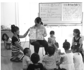
▲子育てサロン「スマイルキッズ」