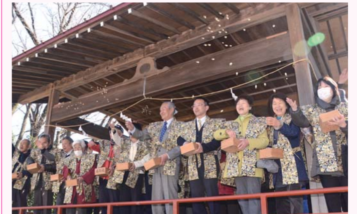
▲元狭山神社での豆まき

町内各地で恒例の豆まきが行われました。皆さん元気な声を出して豆をまいていました。