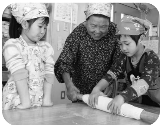
▲東松原保育園の園児と手打ちうどん作り

町には、現在20人があ り、それぞれの活 動を ていま す。健康づくり活動、友愛活動、奉仕活動をはじめとし、趣味やスポーツなど楽しい活動もたくさんあります。コミュニケーションをとることは、認知症予防や介護予防に大変役立ちます。ぜひ、ご加入ください。 加入方法等、詳しくはお問い合わせください。 問合せ 高齢課 ⑤57-7623