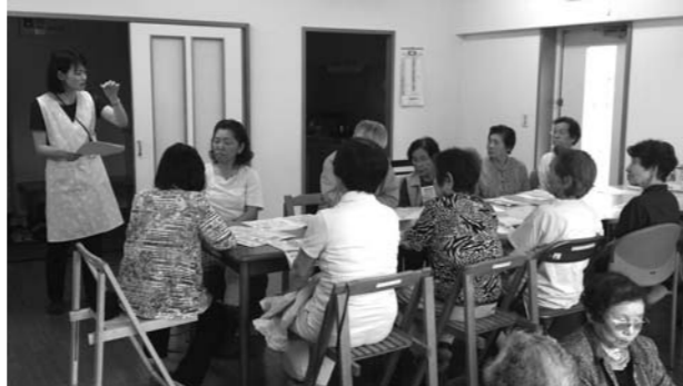
すずらんハウスでの活動風景