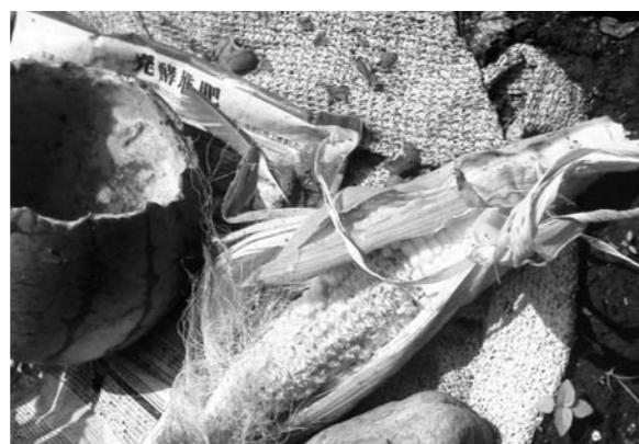
荒らされたスイカとトウモロコシ