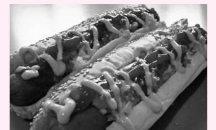
▲瑞穂町からの出品 「ブルックリンホットドック」

日時 5月16日(土)…午前11時～午後4時 5月17日(日)…午前10時～午後3時 場所 青梅市役所 西側駐車場 ※荒天中止