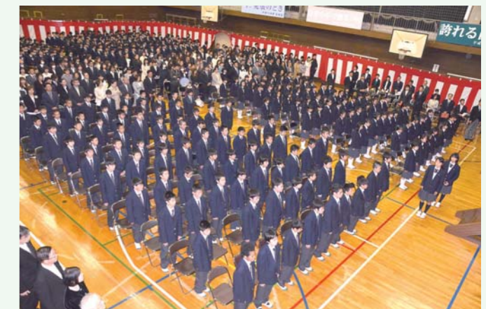
▲二中の入学式（4月7日）