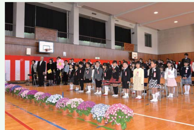
▲二小の入学式（4月6日）

新たな環境にちょっと緊張気味の新入生たちですが、新しい学校生活への期待を胸に、希望あふれる次のステージへの一歩を踏み出しました。