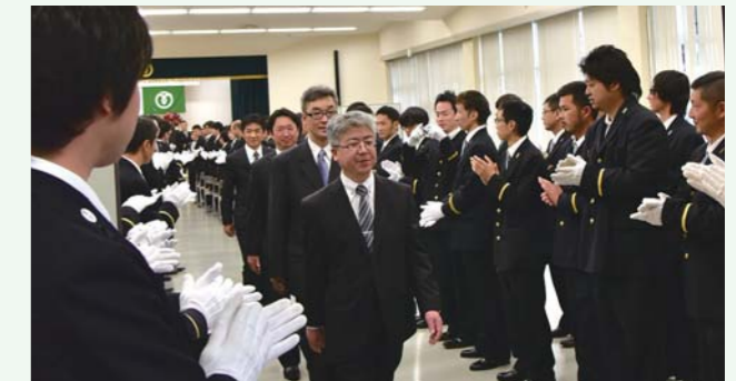
▲退団する団員を拍手で送りました