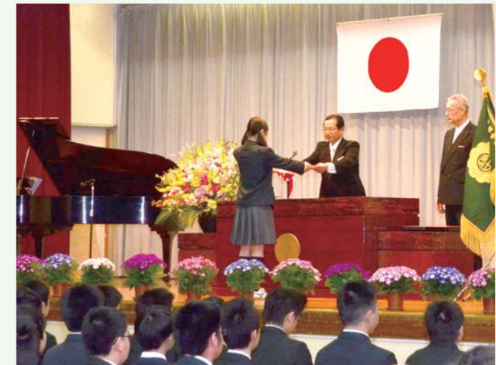
▲瑞中の卒業式（3月20日）