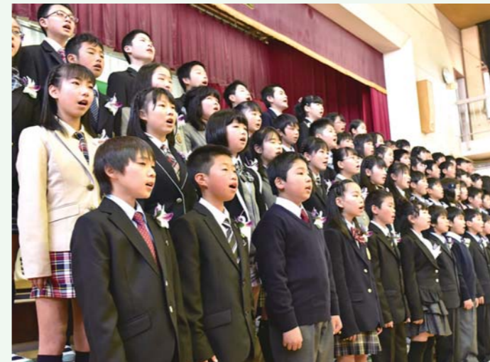
▲三小の卒業式（3月25日）

たくさんの思い出を作った学び舎。お世話になった先生方、多くの友人との別れを惜しみつつ、輝かしい未来へ羽ばたいていきました。