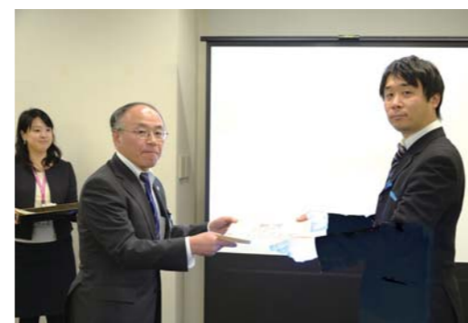
▲都庁での表彰式（3月26日）