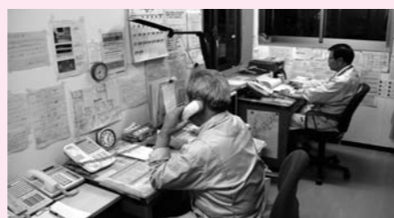
庁舎宿日直警備員