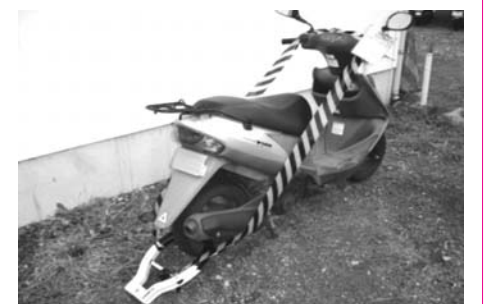
タイヤロックされた原付バイク

都と区市町村では、12月を「オール東京滞納STOP強化月間」と位置づけ、連携した広報や催告による納税推進、差押えやタイヤロック、搜索等の滞納処分など、多様な徴収対策に取り組んでいます。