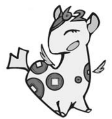
オール東京個人住民税PRキャラクターぜいきりん