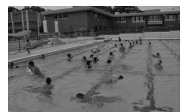
▲昨年の町営プールの様子

日時 7月12日(土)～ 8月31日(日) 午前9時30分～ 午後5時30分 費用 ▼中学生以下：無料 ▼大人：100円 (2時間) ※コインロッカーの使用には100円硬貨が必要です。(使用後に返却されます)。 ※団体の貸し切りで、利用できない場合があります。 ※8月2日(土)午後3時から8月3日(日)午後3時までは総合体育大会水泳競技のため利用できません。 問合せ 社会教育課 ☎ 557-7071 町営プール ☎ 557-6514