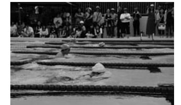
▲昨年の総合体育大会水泳競技の様子

日時 8月3日(日) 午前8時30分開始 (雨天中止) 場所 町営プール 対象 町内在住・在勤・在学の小学校3年生以上の方 【小学生の部】 自由形、平泳ぎ、背泳ぎ(25mに限る) ▼25m(3～6年生) ▼50m(5・6年生) 【中学生の部】 自由形、平泳ぎ、背泳ぎ ▼50m ▼100m 【一般の部】 自由形、平泳ぎ、背泳ぎ ▼25m ▼50m ▼100m 申込み 7月16日(水)までに体育協会事務局(中央体育館内)へ ☎557-7098