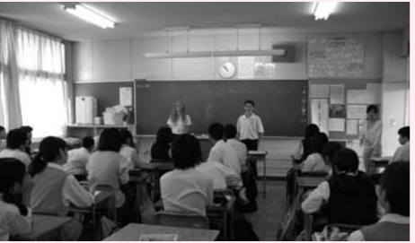
▲平成24年度の交流事業の様子