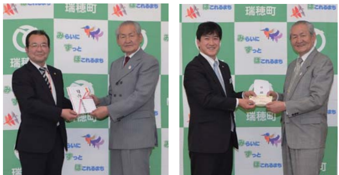
▲車いすの寄付 ▲助成金・テントの寄付

町に、トヨタ西東京カローラより「車いす」が、青梅信用金庫より「あおしん地域文化振興基金助成金」と行事などで使用できる「テント」の寄付がありました。