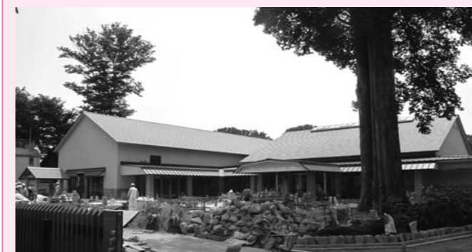
▲新郷土資料館 もうすぐ完成

7月24日(木)までに、所定の応募用紙にて、郵送・ファクス・Eメールで右記応募先へ、または町内各施設に設置する回収箱へ投函してください(お一人様1点)。