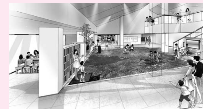
▲ガイダンスホールのイメージ図