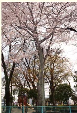
標本木 (今年の写真)