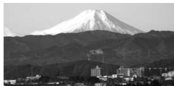
▲スカイホールから望む富士山