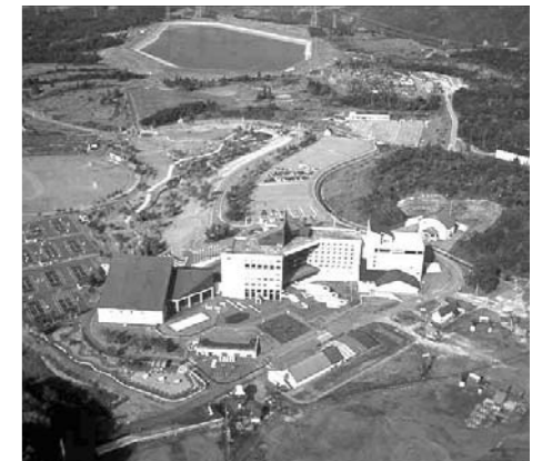
▲ニュー・グリーンピア津南全景

申込み ニュー・グリーンピア津南首都圏予約センター ☎03(5946)2361(午前9時～午後6時。日曜日は除きます) ※瑞穂町民であることをお申し出ください。