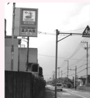
▲広域避難場所を指示する標識