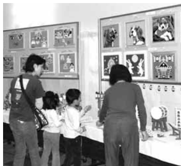
▲昨年の総合文化祭