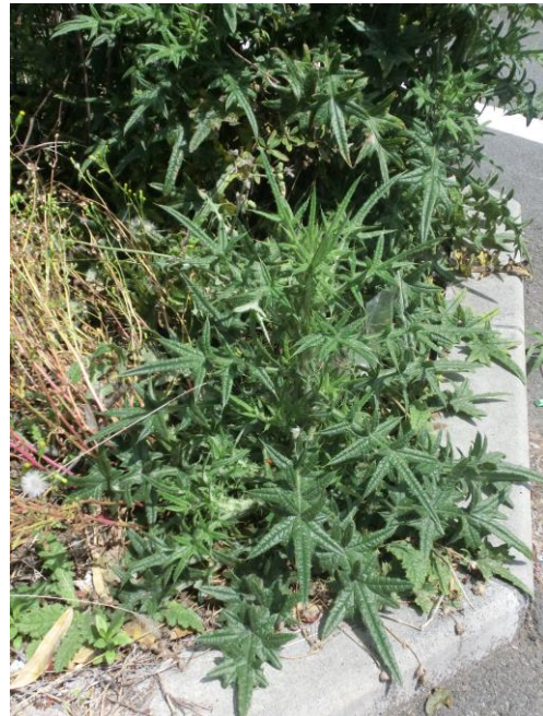
アメリカオニアザミ