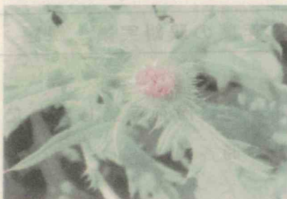
アメリカオニアザミ