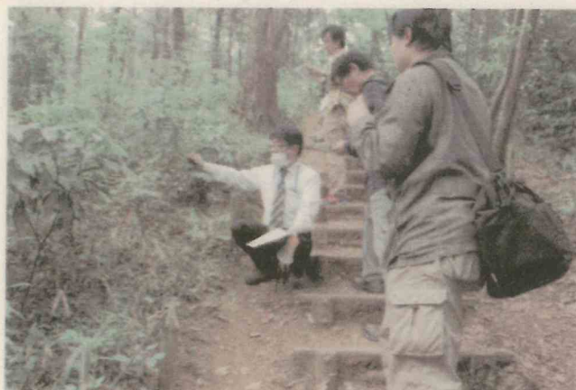
狭山丘陵の動植物観察会