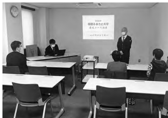
特別講座（歴史コース）の様子

瑞穂町では豊かな自然や先人達が築いてきた文化、歴史など今も大切に継承されています。「瑞穂ふるさと大学」では、町の魅力を再発見し継承することを目的に、10月29日から12月17日にかけて、歴史・観光・自然の3コースに分かれて地域めぐり、講座、瑞穂ふるさと検定を実施しました。瑞穂農芸高等学校の生徒や住民など延べ31人の参加があり、充実した活動を行うことができました。