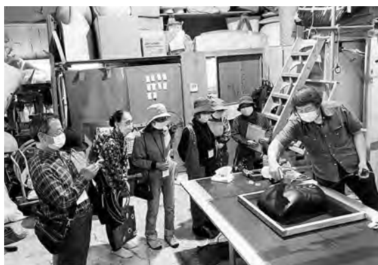
着ぐるみ等の製作工房を見学