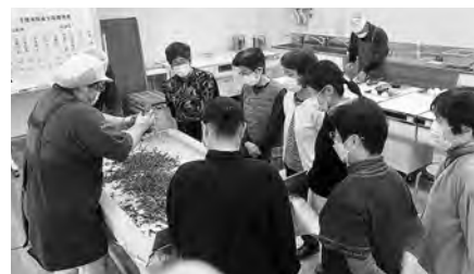
東京狭山茶の手もみ製法を見学する参加者

けやき館では地域の歴史・文化・自然などを広く啓発することを目的とし、「温故知新の会」を開催しています。10月9日および16日は、「東京狭山茶 手もみ実演」が開催され、町の名産である東京狭山茶の手もみ製造の様子が参加者に披露されました。講師は、令和3年度に瑞穂町登録無形文化財に登録された「東京狭山茶手もみ製法」の技術保持団体として認定された、「東京狭山茶手もみ保存会」のメンバー4名です。参加者は手もみの様子を見学し、手もみ製法により作られた狭山茶の風味とコクのある味わいを楽しみました。【問合せ】けやき館 ☎568-0634