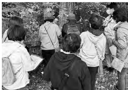
「ナラ枯れ」の現状を見学