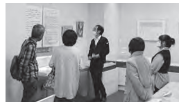
ギャラリートークの様子