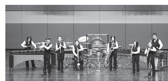
全国大会での演奏の様子

初出場となった第41回全日本アンサンブルコンテスト（3月21日開催）の大舞台でも、日頃の目標である「聴いてくれる方を楽しませる」演奏を行い、見事銀賞を受賞しました。