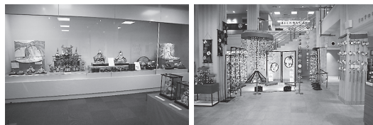
けやき館 ひなまつり展2018の様子