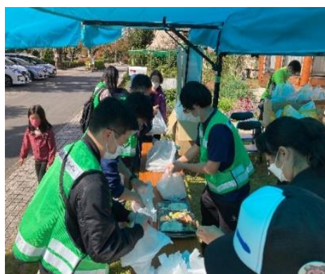
イベントへの参加