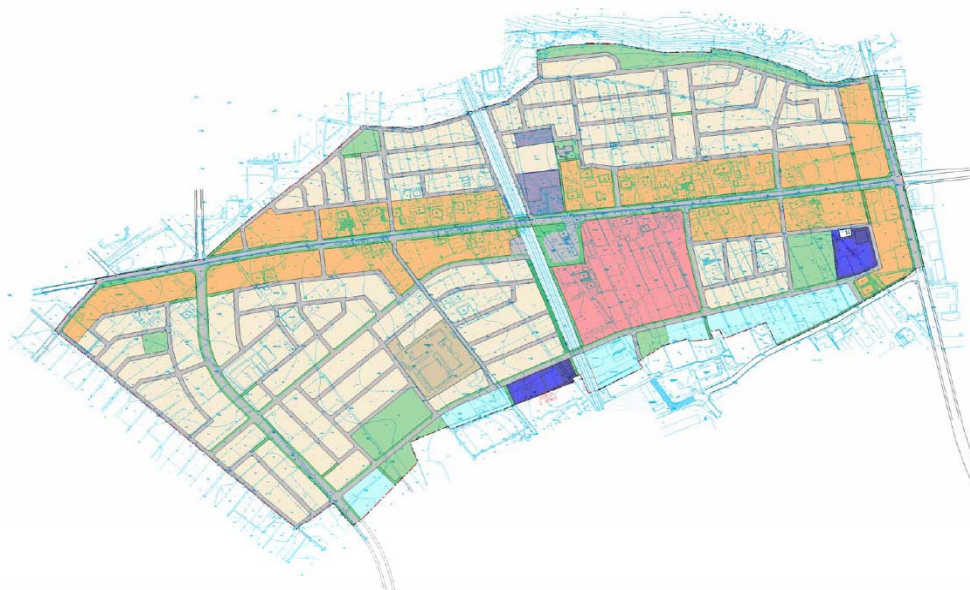
平成 21 年 3 月末現在の平面プラン（案）