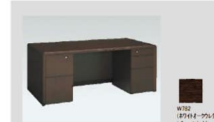
8 両袖机 数量：5台 サイズ：1800W900D720H 設置場所：町長室・正副議長室・副町長室等