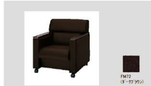
1 応接会議椅子／肘木付／肘木ダークブラウン色 数量：20台 サイズ：680W690D750H 設置場所：議員控室