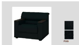
2 安楽イス／肘木付 数量：18台 サイズ：900W800D730H 設置場所：町長室・正副議長室・副町長室等