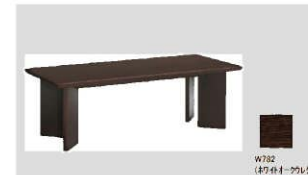
4 センターテーブル(8378E) 数量：5台 サイズ：1400W600D450H 設置場所：町長室・正副議長室・副町長室等