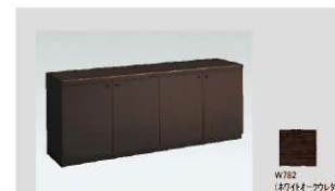
7 クレデンザ 数量：3台 サイズ：1800W470D728H 設置場所：4階正副議長室・応接室