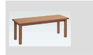
9 センターテーブル(8306) 数量：10台 サイズ：1200W450D620H 設置場所：議員控室