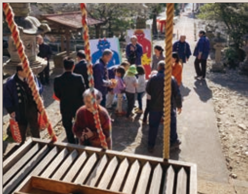
▲阿豆佐味天神社の節分祭 (2019年)

ロシアによるウクライナ侵略が続いています。瑞穂町議会は3月の定例会2日目に決議文を全会一致で議決し、抗議の意を団体意思として表しました。