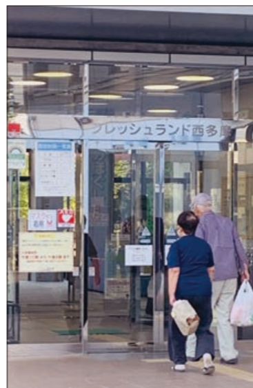
福祉避難所の代替施設となるフレッシュランド西多摩

町長 現在40の協定を締結しているが被災者の生活維持のため、さらに進めていく。 こんな質問もありました 町職員のメンタルヘルスについて 町長 毎年アンケートによるストレスチェックなどを実施。職員の心身の健康維持に努める。