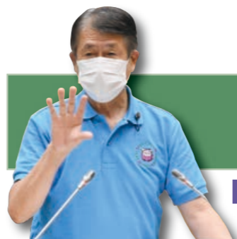
原 隆夫 議員 (公明党)

してできる限りの安全対策を講じる必要があると考える。わが町は、学校・PTA、警察署、庁内内部局（地域課・建設課他）による合同点検を毎年実施し、いくつもの改善がなされている。一層の改善を推進すべきと考えるが、町長の所見を伺う。 教育長 教育委員会では、小学校の保護者などから、ガードレールとガードパイプの設置要望などを受けている。福生警察署と協議して、一小、三小と四小の通学路にはスピード抑止を図るためポストコーンを設置した。さらに、今回の合同点検により、危険箇所を把握するとともに、その対策を協議し、より一層の安全対策を推進していきたい。また、点検の結果、危険箇所や対策必要箇所については可能な限りホームページなどで公表していく予定。