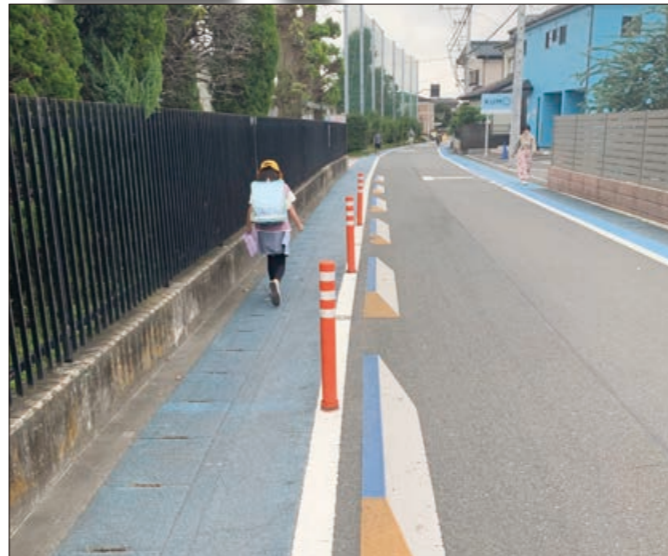
ポストコーンとイメージ狭くで安全対策がされた通学路