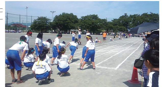
6月3日に行われた第二中学校の体育祭

契約金額 114,696,000円 (落札率75.3%) 契約相手 株式会社スポーツテクノ和広(品川区) 工期 平成29年11月10日