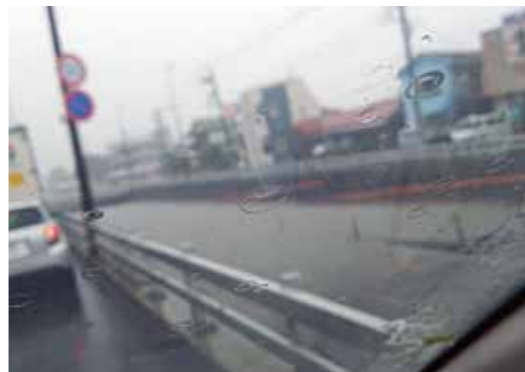
台風9号により冠水した箱根ヶ崎アンダーパス

質問 近年の局地豪雨や台風の大雨等により、住民生活にも大きな影響が出ている。町内には国土交通省による道路冠水注意箇所が、複数箇所挙げられているなど、町としてもさらなる取組みが必要と考える。また、局地豪雨対策については、29年度から市町村での独自運用が可能な小型レーダーを使った局地豪雨予測システムが整備され、国の支援も始まることしている。さまざまな教訓を踏まえ、あらゆる政策資源の活用を提案する。