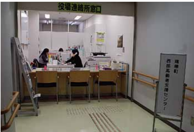
新たに設置された「西部高齢者支援センター」（長岡コミュニティセンター）

質問 平成27年度より第6期介護保険事業計画が施行された。取り組むべき主要課題として、介護に関わるボランティアの育成・サービスマスターの確保・き