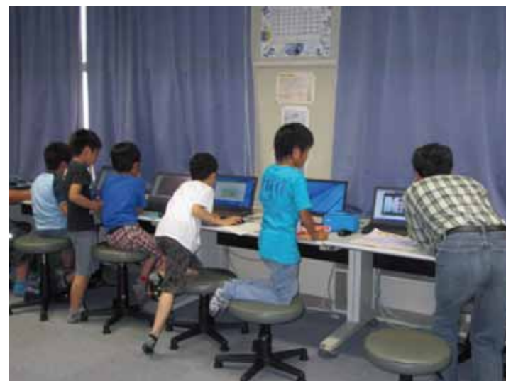
「放課後子ども教室」の様子（第一小学校）

質問 国は「放課後子ども総合プラン」を策定し、次代を担う人材を育成するため、全ての児童が放課後等を安全・安心に過ごし、多様な体験・活動を行うことができるよう、放課後児童クラブと放課後子供教室を一体的あるいは連携し、総合的な放課後対策を講じるよう求めている。町は学童保育クラブ・放課後子ども教室を実施しているが、放課後子ども教室等の更なる充実をすべきであると考え、教育長、町長の所見を伺う。