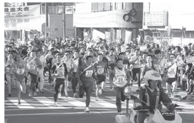
26年1月に行われた瑞穂町駅伝競走大会

質問 豊かな社会に向け、人の生涯にわたるスポーツの本質は、社会的ななかで人間が人間に生き、楽しみ、充