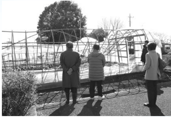
被害状況の説明を受けている様子