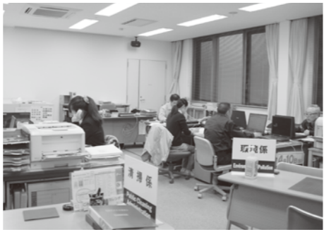
環境問題に対応している環境課 (リサイクルプラザ2階)

す強い指導を行っているが、25年1月、一般廃棄物処分の更新がなされず、許可は失効した。操業休止以降も定期的に現地確認を行い、臭気の発生などを監視し、地元町内会などの情報交換も継続している。