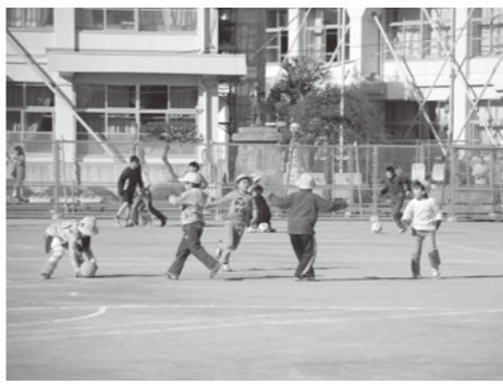
休み時間に遊ぶ子どもたち（第一小学校）

問① 学力が低い要因は何か。 教育長 学校の教育力の向上と家庭学習の充実の2点が課題。 問② 町づくりへの影響は。 町長・教育長 学力とまちづくりは連動していると思う。優秀な人材を育てる