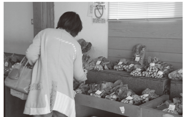
地場野菜が並ぶ「ふれっしゅほうす」

要となる。現段階で、施設の具体的な拡充計画はない。 問② 新規就農者への支援について。 町長 都との連携支援のほか、新規就農者確保事業費補助や農地リフレッシュ再生事業費補助などの直接支援にも努めている。