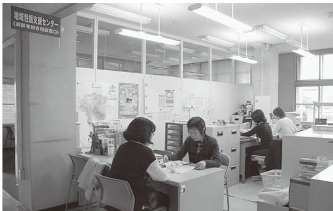
高齢者についての相談を受けている地域包括支援センター（役場1階）