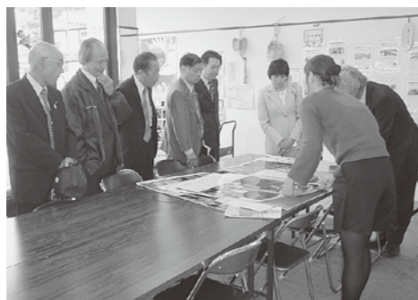
中心市街にある「まちづくり支援センター」

上市市は、市民と行政が協働でまちづくりを実践し、様々な市民グループにより、景観の整備など行っている。市役所内にあった「まちづくりセンター」を平成18年に中心市街に移設。そこは、まさしく住民活動の拠点となっている。また、協働のまちづくり活動支援事業として、住民提案の企画を公開審査、市民活動を支援する目的の「やる気まんまんプラン」があり住民活動への補助がされている。行政の積極的な行動・取り組みにより、住民活動が活発に行われていることに感銘を受けた。