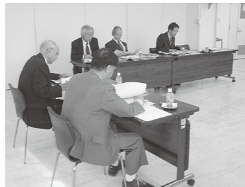
担当者から説明を受ける様子

寒河江市ではくつろぎのある都市空間づくりとして、歴史と文化を生かした美しい都市を目指し、「花・緑・せせらぎで彩る寒河江」を市民主体で取り組み、市民6,000人の参加による約10万本の花の植栽や、42自治会で組織する「フラワーロード推進協議会」が中心となった維持管理などが行われている。また『ヒストリーロード』、『アートロード』など散策コースも整備し、市民や観光客に提供している。この取り組みはわか町の「回廊計画」や観光・産業振興にとって、大きな収穫であった。