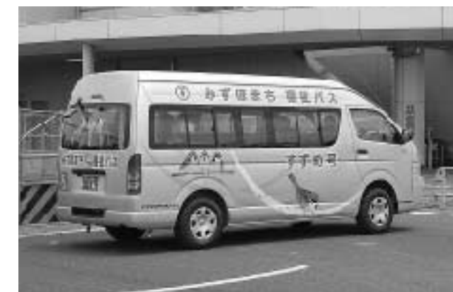
新しく導入された「すずめ号」

質問 4月から福祉バスのルート変更があった。利用者の生の声を聞き、特に問題点であった時間の短縮と利用率の向上をはかるというものであったと思うが、一方でスタート時の目的である福祉の観点としての切り捨てがあつてはならないと思う。2か月を経過する中で、年度途中でも問題点に対してはこまめに改善をはかるべきと考えるが、ルート変更後の利用者への反応を含め状況はどうか。