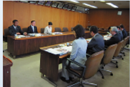
4月27日、議会だより編集についての視察受け入れ（静岡県駿東郡清水町）