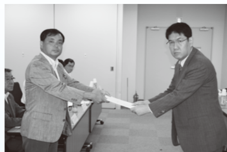
8月7日、北関東防衛局での要望