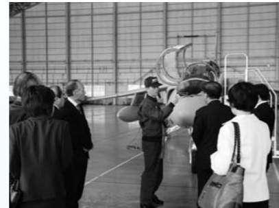
11月25日、基地対策特別委員会視察（入間基地）