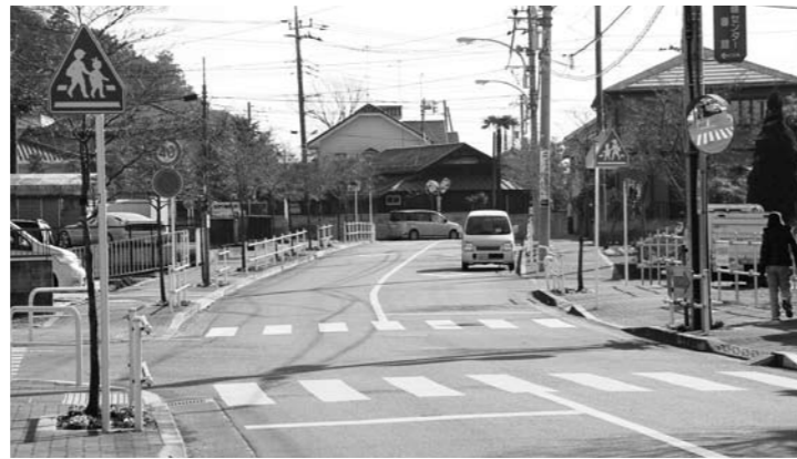
都市計画道路 福3・5・17号線

質問 町内の骨格的道路としての都市計画道路も16号バイパスの開通など、道路環境の変化を受け、見直すべき場所もあるのではないかと。役場北側の石畑方面へ延びる福3・5・17狭山ヶ岡線など、今後計画どおり進めることは費用対効果を含めて有意性があるのか。また、今後の道路網の整備には歩行者道の確保とともに、地域的に