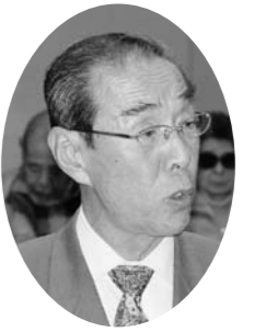
竹嶋 久雄 議員(自民)