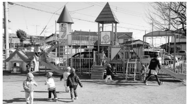
園庭で遊ぶ園児(狭山保育園)

質問 少子化対策が叫ばれるようになり久しいが、様々な面で子育てがしにくい社会であると感ずる。新設でも子育て支援策に力を入れており、町でも様々な努力があると思うが、さらに安心して子育てができる町を目指し、次の点を伺う。町長 待機児対策と保育料の軽減について。町長 現在、新規の認可保育所の相談を受けており、新たな保育園