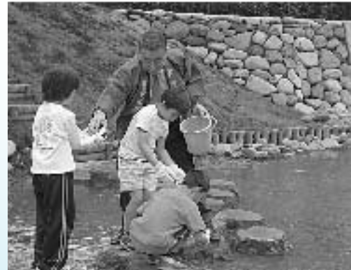
子どもたちによるイシガメの放流

午後に行われた記念式典では、長年にわたる懸案事項であった残堀川河川改修完了の喜びを分かち合うと共に、「残堀川の清流を後世に引き継いで欲しい」との願いを込めて記念植樹やイシガメの放流などが行われました。