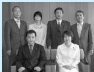
議会だより編集委員会

4月に行われた町議会議員選挙で、新人5人を含む18名の議員が選任され、新たな議会構成となりました。